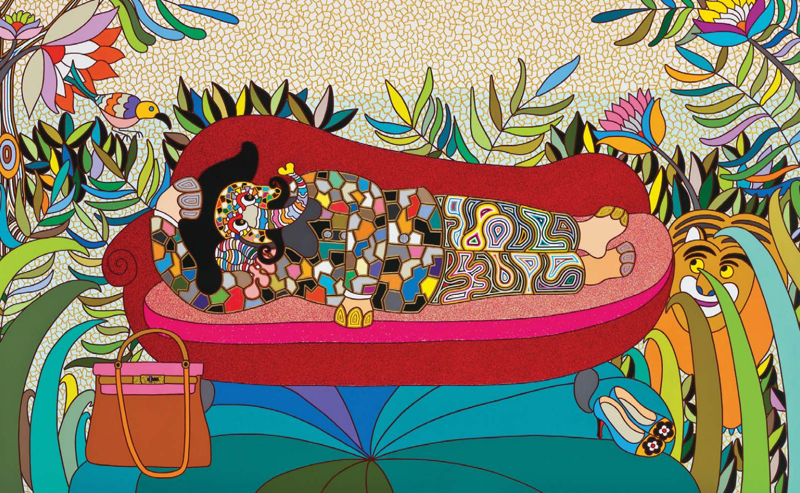
Asui의 환상적인 정글 The Fantastic Jungles of Asui

gold, acrylic on canvas 89.5 × 145.5cm 2013