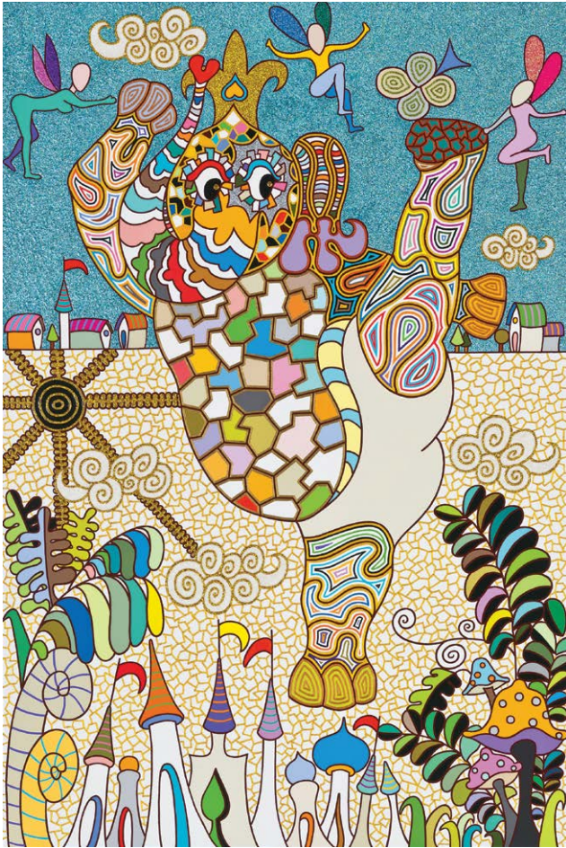
거침없이 하이킥 High Kick

gold, acrylic on canvas 90.5 × 60.5cm 2013