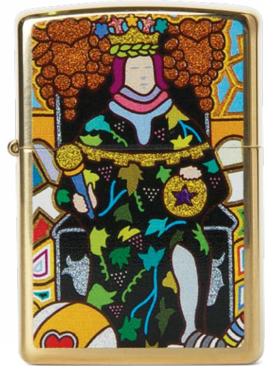
Zippo Limited Edition From Millionaire2