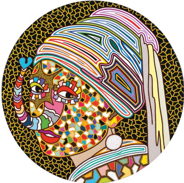
진주 귀걸이를 한 소녀 Girl with a Pearl Earring