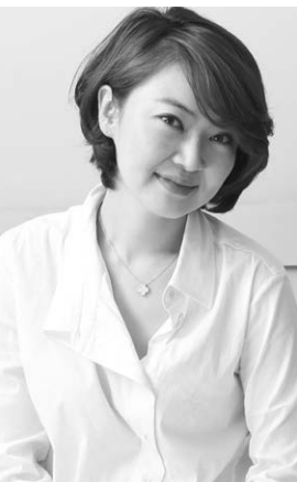
권수현 Kwon Soo Hyun (b.1974)

권수현 작품의 주제, 코끼리는 암컷이 이끄는 가족 단위 무리생활을 하며, 무리생활을 통해 서로 의사소통을 나눈다. 코끼리는 생태계에서 여러 가지 중요한 일을 수행하여 많은 종류의 동물이 살 수 있는 터전을 마련해 줄 뿐 아니라 기억력이 좋아 사람들은 수 천년 전부터 코끼리를 길들여 이용해 왔다. 이러한 코끼리는 동서양을 막론하고 힘, 승리, 장수, 부귀영화 등 긍정적인 의미를 지닌다.